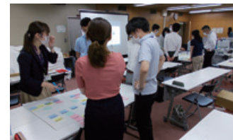
岐阜市役所さまにて開催した研修会