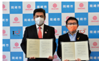
岡崎市役所さまとの調印式