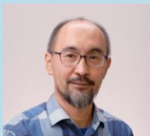
主催者代表 中京大学 現代社会学部 教授

■専門分野 発達障がい児者の発達支援システムの開発、発達支援技法の開発・専門家養成などであり、なかでも自閉症スペクトラムの発現メカニズムに関する生物学的精神医学研究を浜松医科大学において取り組んでいます。