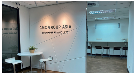
統合に合わせて新オフィスを開所

さらに、タイを主軸としながら、インド市場や中東市場への進出も視野に入れて、取り組みます。