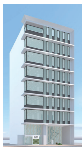
「CMC GROUP NAGOYA BASE」完成イメージ ※検討段階のため、完成時の外観が異なる場合がございます。

新拠点では、環境負荷や従業員の働きやすさへ配慮しながら、デジタル変革や新事業創造に向けた共創活動を進めます。完成は2025年を予定しています。