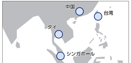
当社グループの東南アジア地域の拠点