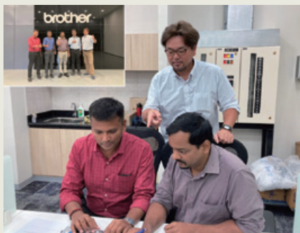
インド工場立ち上げの業務可視化・標準化