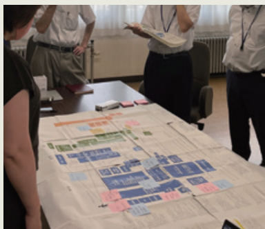
情報整理から目指す姿の議論を支援