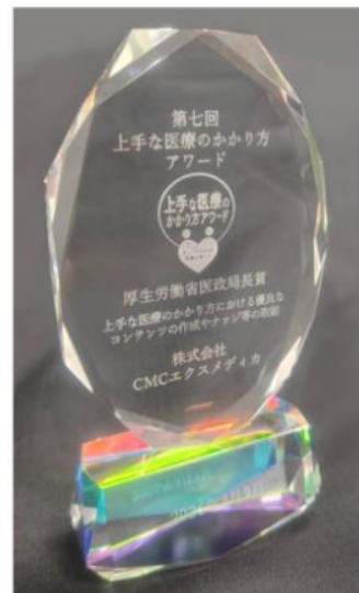
表彰状とトロフィー